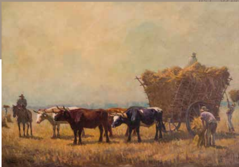
La cosecha RAFAEL CORREA 119 x 165 cm Sin fecha