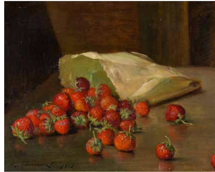
Frutillas MANUEL THOMSON 48 x 55,5 cm 1901

Finalmente, el lienzo de mayores dimensiones y que se aparta de la temática descrita es “Puente de Charenton” de Alberto Valenzuela Llanos (1869-1925), artista generacionalmente cercano al grupo incluido en esta habitación. Su experiencia europea no solo le entregó vistas que diferían de su Chile natal, sino que adquirió allá la costumbre de pintar al aire libre. Luego de un rápido diseño en carboncillo directo sobre la tela, indaga en torno a efectos lumínicos y atmosféricos que hasta entonces desconocía. Esta solución plástica culmina precisamente en “Puente de Charenton”, mientras Valenzuela Llanos se encontraba en Francia.