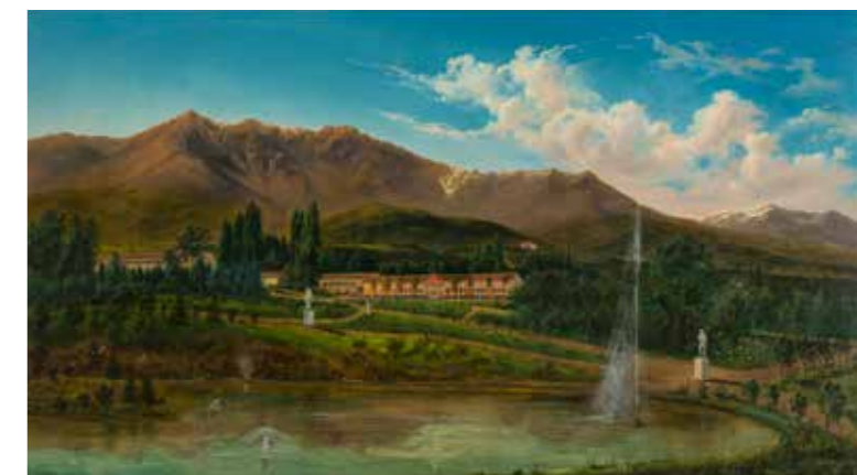
Peñalolén ANTONIO SMITH 118 x 194 cm 1874

Las paredes de este hall presentan terminaciones clásicas que siguen el diseño general del edificio. Destacan las ménsulas en la parte superior de los pilares y el cielo en casetones, términos arquitectónicos que aluden respectivamente a las salientes que sirven de soporte y a los adornos huecos y geométricos regularmente dispuestos. Sobre el piso, revestido de un ajedrezado en mármol blanco y negro, se alinean una serie de bancas cubiertas de piedra verde y patas en bronce.