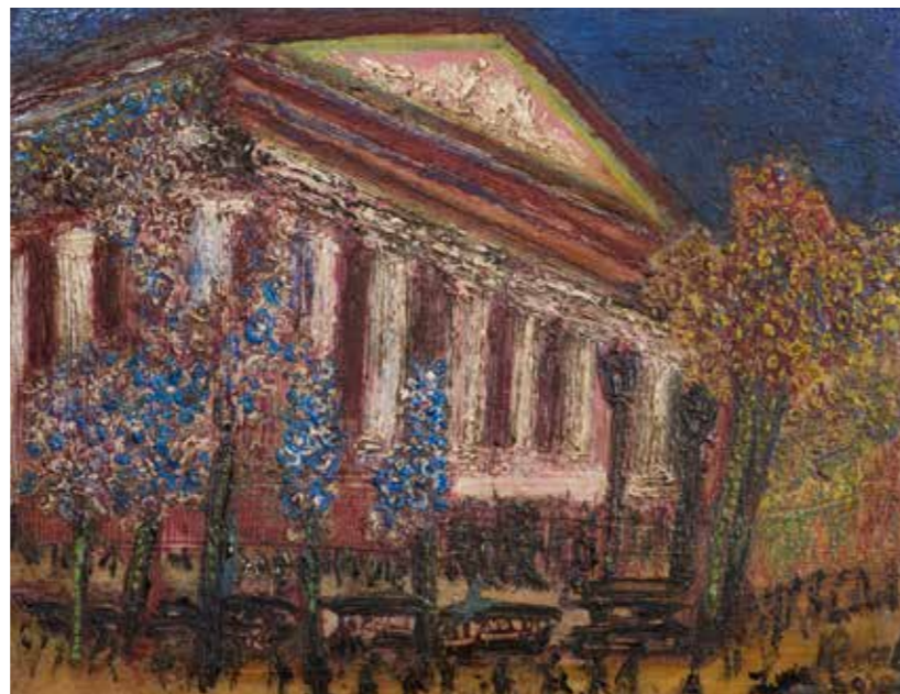
Congreso Nacional LUIS HERRERA GUEVARA 32,5 x 38 cm 1930

“Penitente”, óleo sobre cartón del año 1936, destaca una figura arrodillada de espaldas frente a un altar, con los brazos abiertos y en una de sus manos cuelga un rosario, que contempla una imagen sagrada. La variación del color es baja y la composición ocupa espacios equilibrados. Luego, con una temática más mundana nos recibe “Cantínera”, un retrato de 1942, en óleo sobre tela, que exhibe una figura femenina centrada con vestimenta de aspecto masculino. Su paleta está marcada por los rojos, azules, blancos, amarillos y rayas negras. Ambas obras tienen trazos muy extensos y planos.