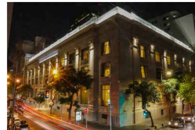
Edificio del Banco Central de Chile, 2018

El inmueble está clasificado como construcción de Conservación Histórica, denominación que resguarda a las edificaciones de importancia nacional, histórica y arquitectónica.