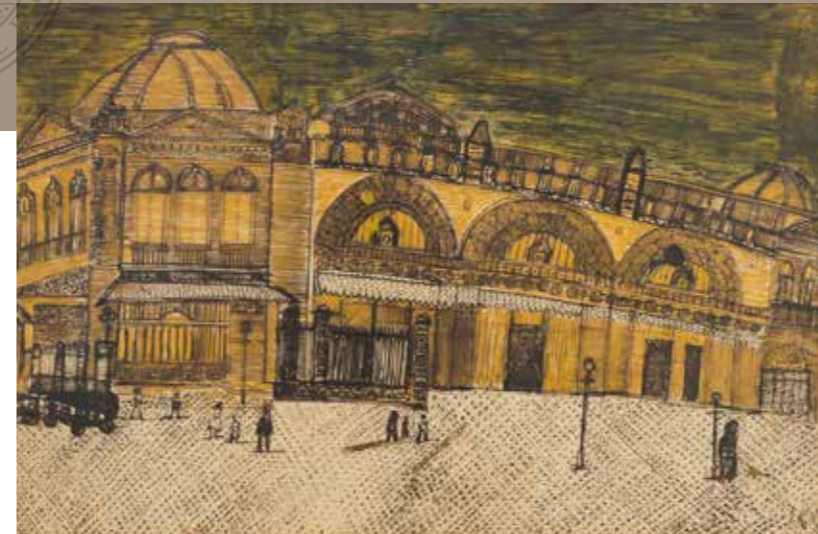
Estación Mapocho LUIS HERRERA GUEVARA 48 x 65 cm 1933

Las otras cuatro pinturas muestran acontecimientos urbanos, como “Congreso Nacional” óleo sobre cartón de 1930, Herrera Guevara captura la arquitectura clásica del centro político de Santiago. El imponente edificio se recorta sobre un fondo oscuro antecedido por grupos de árboles. Su paleta de color es baja, pero su pincelada es suelta y tiene detalles con más materia pictórica.