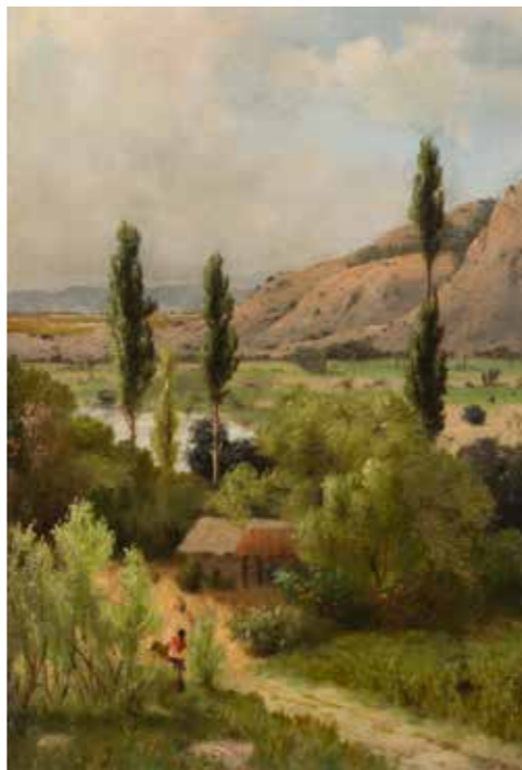
Cajón del Maipo ( derecha ) PEDRO LIRA 117 x 91 cm Sin fecha