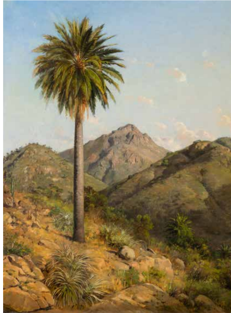
Gran palma ONOFRE JARPA 149 x 120 cm Sin fecha

Las paredes del hall central presentan terminaciones clásicas fieles al diseño general del edificio. Se distinguen los apoyos en el tope superior de los pilares y un cielo alto decorado con casetones y adornos geométricos regularmente dispuestos.