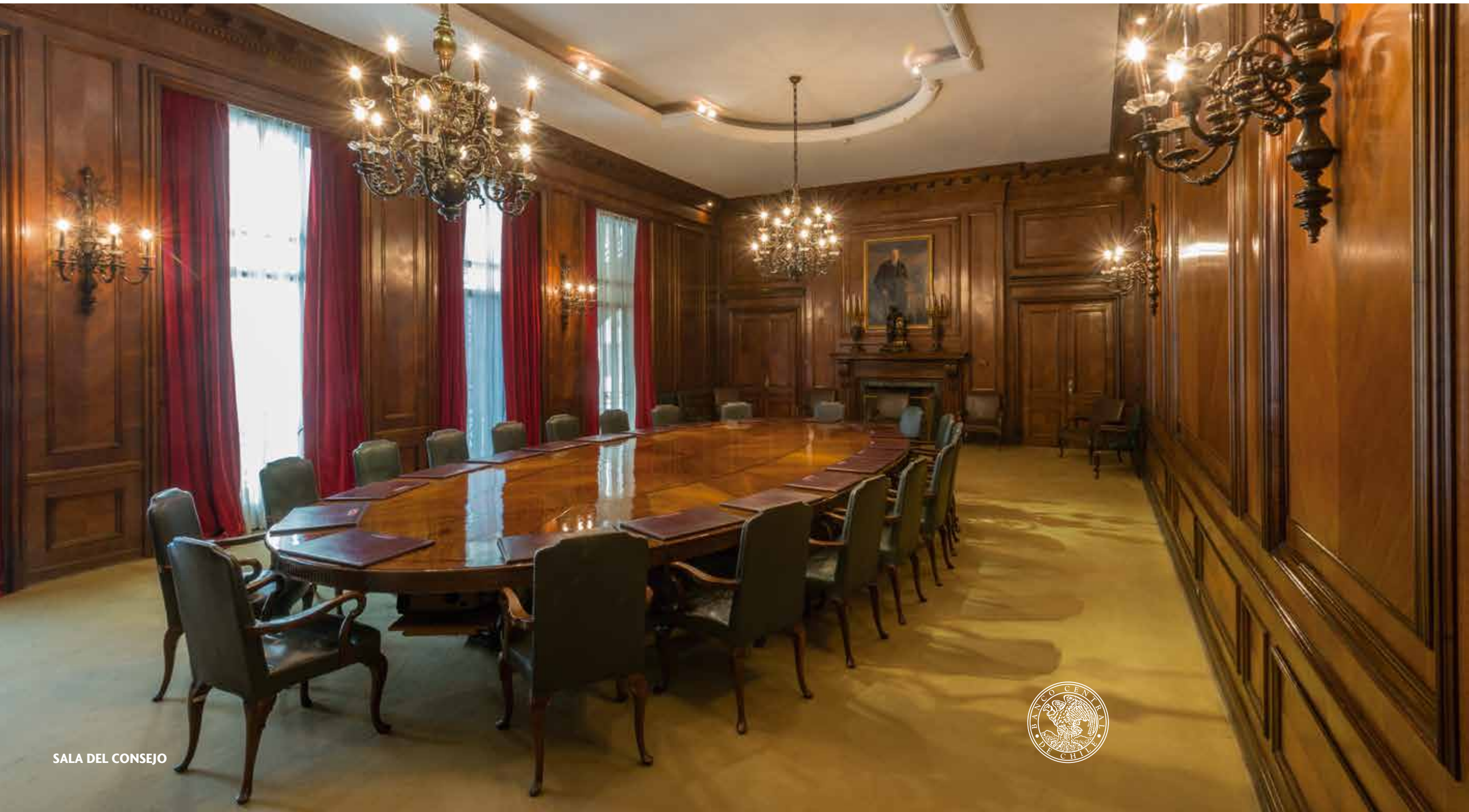
SALA DEL CONSEJO