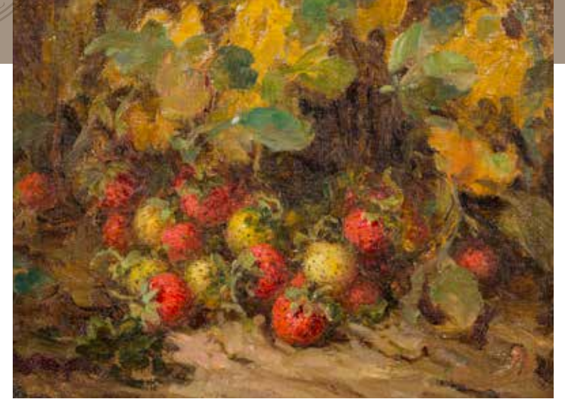
Frutillas JUAN FRANCISCO GONZÁLEZ 50 x 59,5 cm Sin fecha

Finalmente, el lienzo de mayores dimensiones y que se aparta de la temática descrita es “Puente de Charenton” de Alberto Valenzuela Llanos (1869-1925), artista generacionalmente cercano al grupo incluido en esta habitación. Su experiencia europea no solo le entregó vistas que diferían de su Chile natal, sino que adquirió allá la costumbre de pintar al aire libre. Luego de un rápido diseño en carboncillo directo sobre la tela, indaga en torno a efectos lumínicos y atmosféricos que hasta entonces desconocía. Esta solución plástica culmina precisamente en “Puente de Charenton”, mientras Valenzuela Llanos se encontraba en Francia.