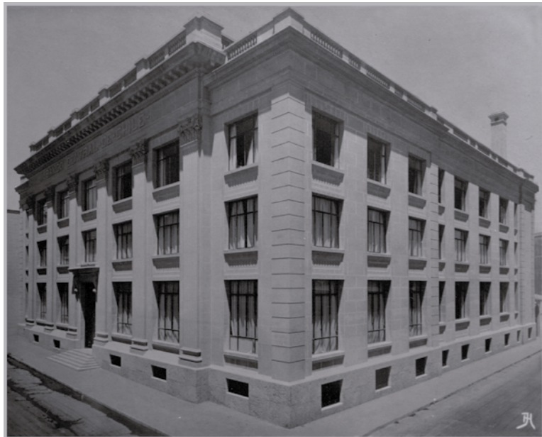
Edificio del Banco Central de Chile, 1928

La edificación duró casi dos años y fue entregada en diciembre de 1928, abriendo sus puertas al público el 17 de ese mes. En su construcción predomina la albañilería, dando prueba de una unidad sólida. La fachada principal se distribuye y ordenada en forma simétrica y ornamentada en cada uno de sus vanos, siguiendo elementos del orden clasicista el cual hace referencia a los cánones estéticos grecorromanos, estos se organizan bajo la medida, armonía y equilibrio entre sus partes constitutivas. También exhibe elementos eclécticos, al combinar estilos. Esta maciza y segura construcción remata en su frontis con una leyenda: "Banco Central de Chile". Las líneas arquitectónicas de su fachada y los objetivos corporativos del Banco Central, tienen en común características tales como: solidez, orden, progreso y estabilidad.