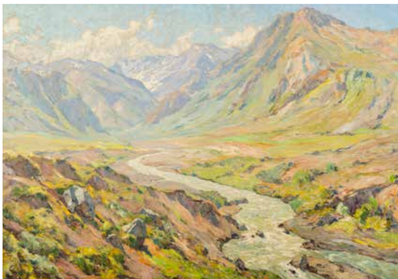
Cajón del Maipo LUIS STROZZI 168 x 226 cm Sin fecha