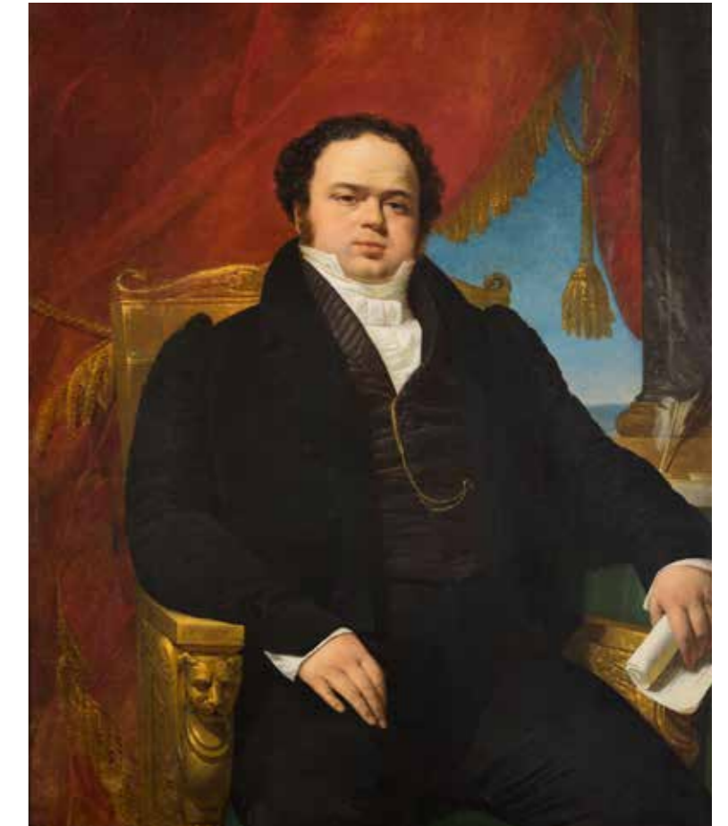
Retrato de Mariano Egaña RAYMUNDO MONVOISIN 176 x 117 cm 1827