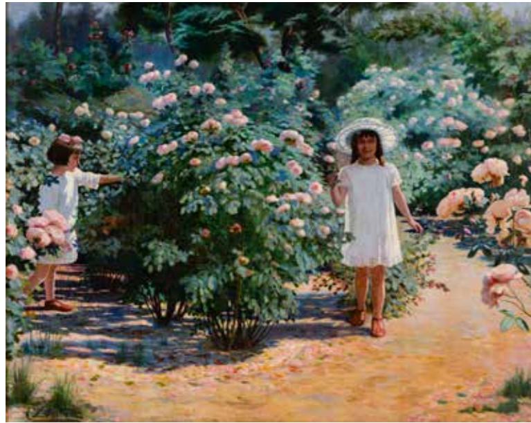
Niñas en primavera CARLOS LASTRA 177 x 220 cm Sin fecha

Finalmente, las pinturas de Thomas Somerscales (1842-1927) también decoran las paredes del hall . Son las imponentes marinas tituladas “Combate de Angamos” y “Homeward bound”. Para dar el mayor realismo al primer óleo, el marinista se documentó con sobrevivientes de la batalla, mostrando el momento en que el blindado “Cochrane” se enfrenta al monitor “Huáscar” comandado por el almirante Miguel Grau, durante la Guerra del Pacífico (1879-1883). Los conocimientos del artista en torno a la construcción de barcos, las velas desplegadas de navíos y las cualidades del mar en cuanto al movimiento de las olas y su colorido, le permitieron un manejo plástico en sus obras.