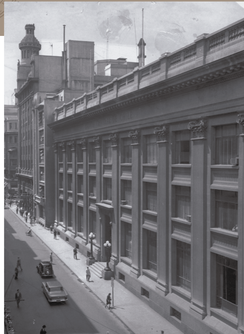
Edificio del Banco Central de Chile, 1960

Se accede al interior de la institución ascendiendo por una escalinata central de cinco peldaños donde reposa una gran puerta en cerrajería de bronce, cuya ejecución fue realizada en los talleres Carlos Mina e hijos . Las medidas son de 6,20 m de alto por 3,25 m de ancho, con un peso total de 6.000 kg en bronce fundido. El diseño cuenta con elementos clásicos característicos, siguiendo la línea del edificio, destacando la sobriedad decorativa. En el centro sobresale un par de aldabas y en sus segmentos laterales se acentúan piezas fitomorfas, en tanto que, en el módulo inferior de la hoja derecha, se observa una placa que dice "C. MINA e HIJOS, ERASMO ESCALA 3096-SANTIAGO DE CHILE".