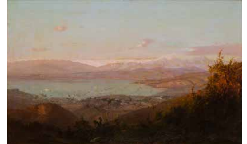
Bahía de Valparaíso ( derecha ) THOMAS SOMERSCALES 90 x 182 cm 1891

En cambio, “Captura de la María Isabel”, óleo sobre tela de dimensiones mayores, recrea un combate naval histórico, realizado por Somerscales en 1921. Los armoniosos juegos de grises y azules, reproducen minuciosamente la escaramuza naval sobre la tela, llena de detalles sobre los barcos y plena de fidelidad en lo que se refiere a la contienda en el mar, deteniendo el momento preciso cuando uno de los barcos nacionales, bajo las órdenes del comodoro Manuel Blanco Encalada, captura a la fragata española “María Isabel”.