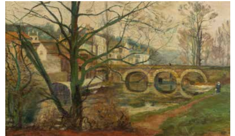
Puente de Charenton ALBERTO VALENZUELA LLANOS 105,5 x 146,5 cm Sin fecha