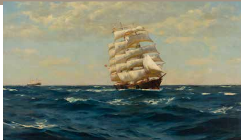
Mar afuera THOMAS SOMERSCALES 117 x 194 cm 1915