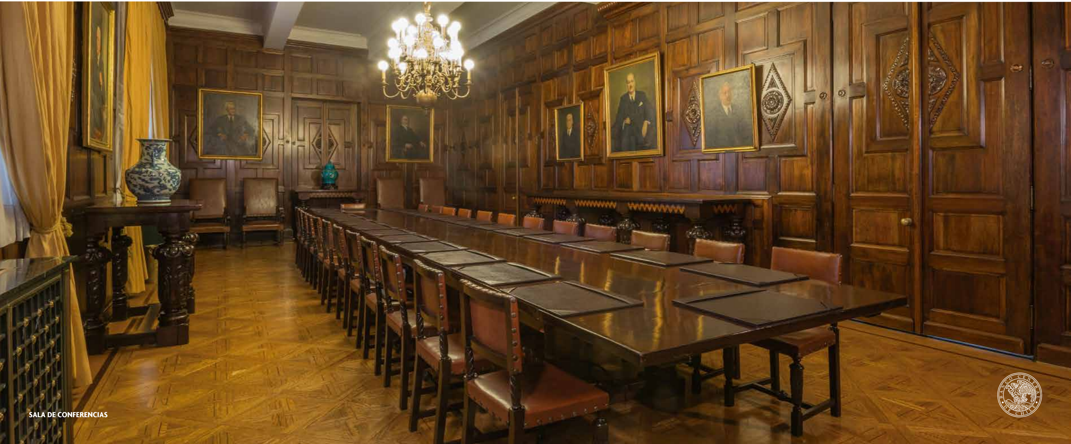
SALA DE CONFERENCIAS