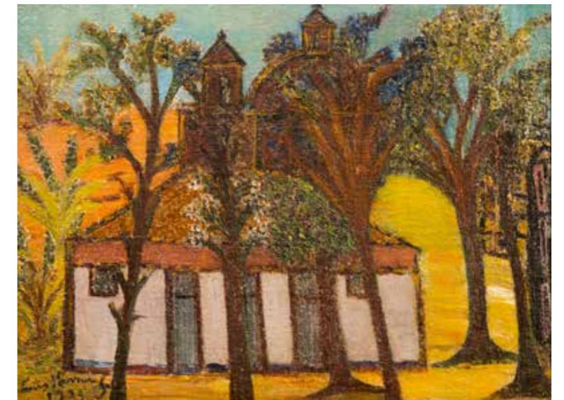
Iglesia o primavera en Santiago LUIS HERRERA GUEVARA 61,5 x 77 cm 1939

El mobiliario que acompaña este conjunto de obras es de líneas simples y contemporáneas. Se trata de una mesa rectangular de madera, acompañada por 10 sillas tapizadas en cuero. Junto a ella, una gran alfombra tejida, con diseño fitomorfo conformado por trazos esquemáticos que cubre parcialmente el piso de parquet . Sobre la mesa pende una lámpara en bronce patinado de 16 luces con dos hileras de candelabros curvos, que nacen de un soporte con forma de balaustra, terminando con una esfera en la parte inferior.