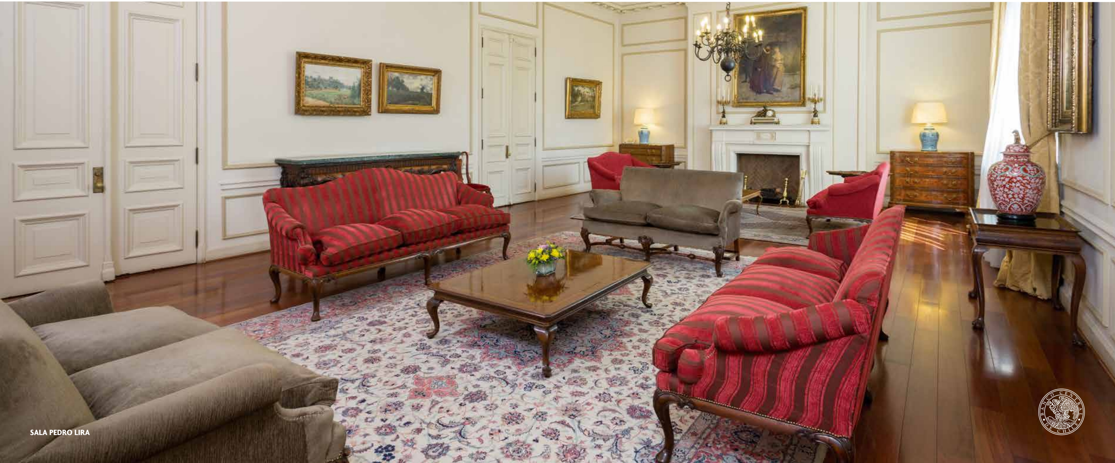
SALA PEDRO LIRA