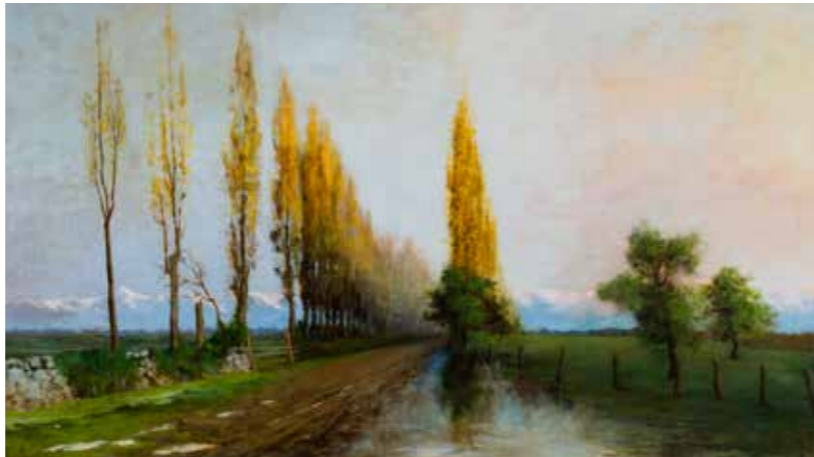
Afuera de Chillán ENRIQUE SWINBURN 126 x 195 cm Sin fecha

Amplios paisajes ofrecen del mismo modo los dos lienzos de Enrique Swinburn (1859-1929): “Afuera de Chillán” y “Paisaje con vacas y garzas”. Pintor asimismo de marinas, estructura estos cuadros de escenarios idealizados por medio de un dibujo cuidado y académico. Es decir, con esmero define los elementos que debe contener cada pintura, a partir de los cuales aplica el color de manera naturalista.